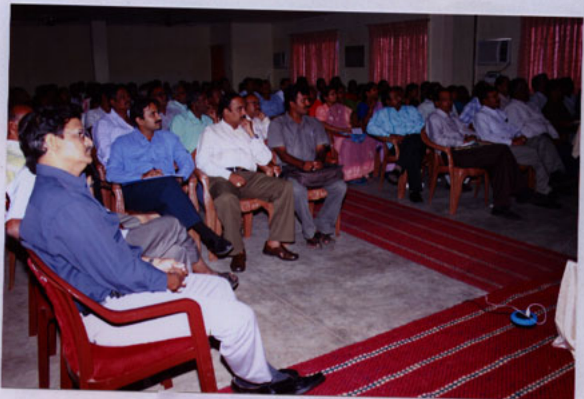
A view of the audience during the proceedings.