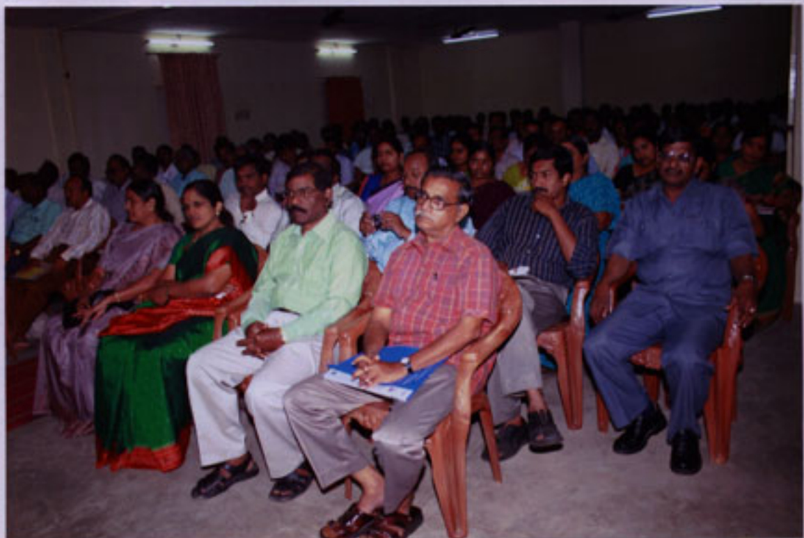
A section of the audience at the Inaugural session