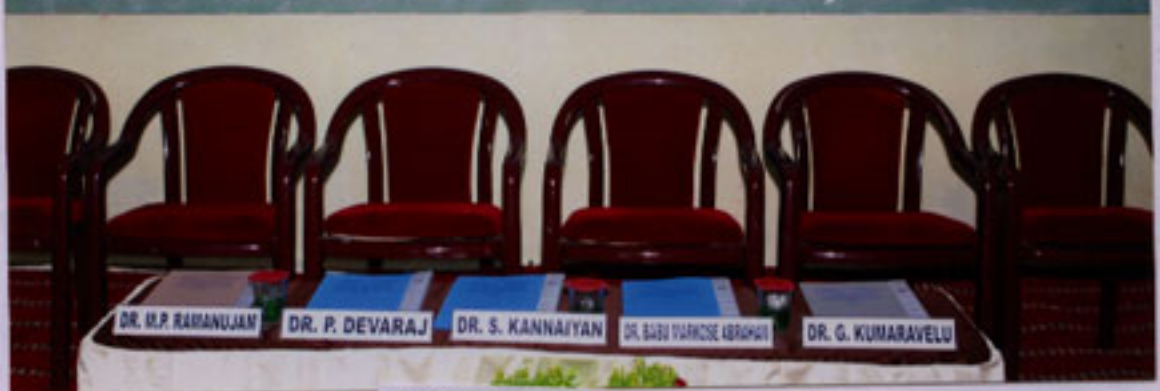
A view of the stage at Auditorium